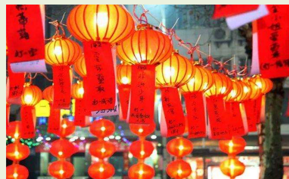
<上海豫園に飾られた謎解き>