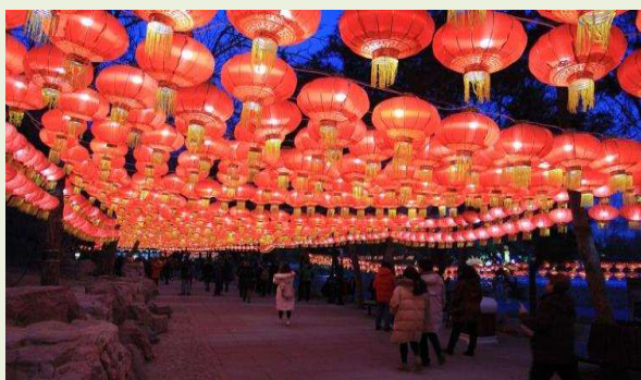
<北京圓明園の灯籠飾り>