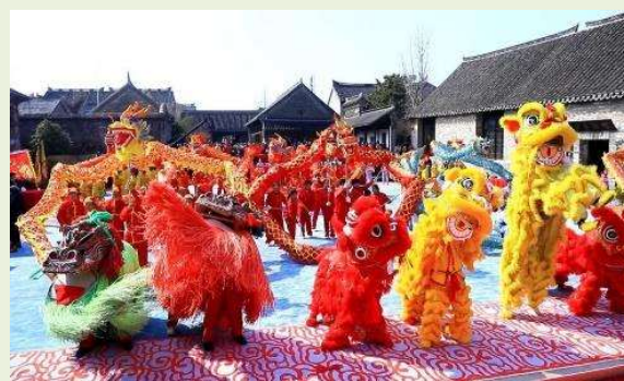
<広州街頭の獅子舞と竜踊>