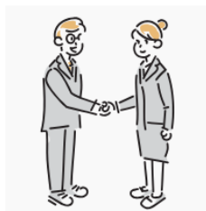
多様な人材の 活躍