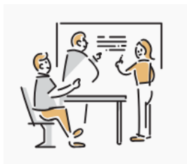
お客さま満足の 追求

当社は仕入先と販売先がそれぞれ150社程度あり、多くの取引先を抱えています。取引先の課題を解決することが事業の源泉であることからお客さま満足の追求はこれまで以上に進めていくとともに、多様なお客さまに対応するには幅広い知識や経験を持つ人材が必要です。また、農業の発展のためには当社のエリアはもとより、地方の発展も貢献していくべきと考えます。一方、適切な管理体制で事業継続を行うには法令遵守は欠かせないことから次の4つをマテリアリティに掲げ、取り組みを進めてまいります。