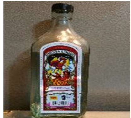
【人気のジン：ヒネブラ・サンミゲル】

フィリピンで最も人気のお酒と言えば、蒸留酒の「ジン」です。フィリピン人の年間のジン消費量は1人当たり1.4リットルとされています。実際、フィリピンは世界一のジン消費国とされています。そして世界で最も消費されているジンと言えば、写真のヒネブラ・サンミゲルになります。アルコール度数80度と強烈ですが、甘目のコーヒーや粉ジュースと混ぜるなどフィリピン独自の飲み方があります。スペイン文化の影響、ラテン系の陽気な気質のフィリピン人にとっては、お酒は人生の友と言えるようです。