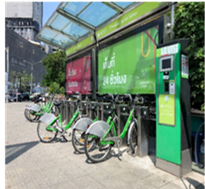
【自転車ステーション】

バンコクには渋滞の多い地域を効率良く移動するために、レンタル自転車が設置されているところがあります。バンコク都が運営する「PUN-PUN」は、都内に50か所のバイクステーションを有し、各ステーション間を行き来できるレンタル自転車サービスです。登録料は320タイバーツで、パスポートの提示により外国人でも利用可能です。また、レンタル料金は15分以内の利用であれば無料となっており手軽に利用することが出来ます。渋滞を避ける移動手段としても快適で、また、自転車からの景観も新鮮で楽しいものがあります。但し、交通事故には十分注意して利用してください。