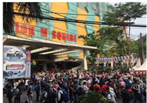
【縁日祭の様子 (ブロックM)】