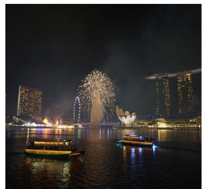
【旧正月の花火の様子】

今年の旧正月は2019年2月5日～6日となっておりますので、体験してみたいかがでしょうか。