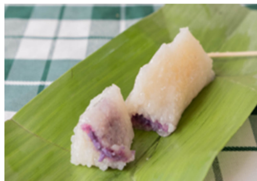
【スイーツのスマン】