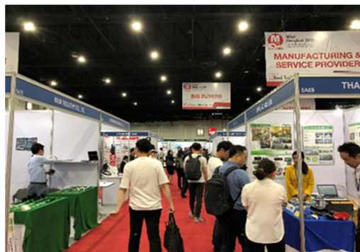
【商談会会場の様子】