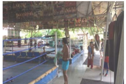
【マニラ近郊にあるボクシングジム】