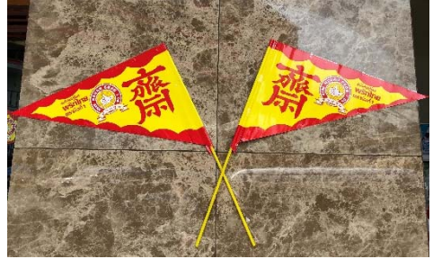
【バンコクの中華街の様子】