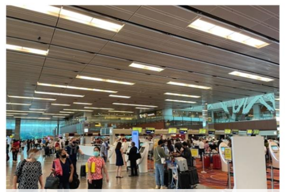
現在のチャンギ空港の様子

しかしながら、日本が観光客の受け入れを再開したことや、コロナ禍で減便していた航空会社各社がシンガポールー日本間の便数の増便を発表していることなど、少しずつインバウンド増加への明るい兆しが見えてきています。