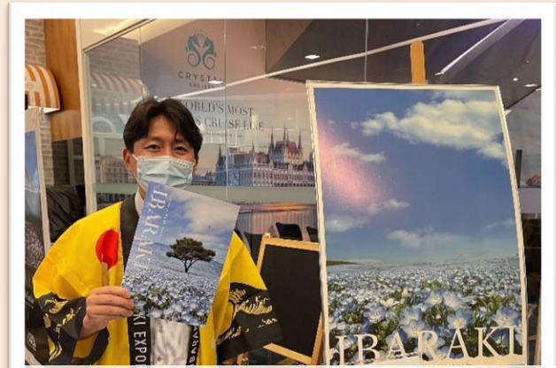
茨城県の観光PRを実施した県庁職員

茨城県も本イベントに参加しており、茨城県の観光PRを実施しました。日本への旅行に関心のあるシンガポールの方々から、茨城県へ様々な意見・質問がありましたので、その一部をご紹介します。