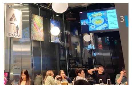
Toyama Night 店内の様子

JAPAN RAIL CAFEでは、今後も定期的にイベントを企画しており、日本の魅力をシンガポール人に向けて発信していく予定です。